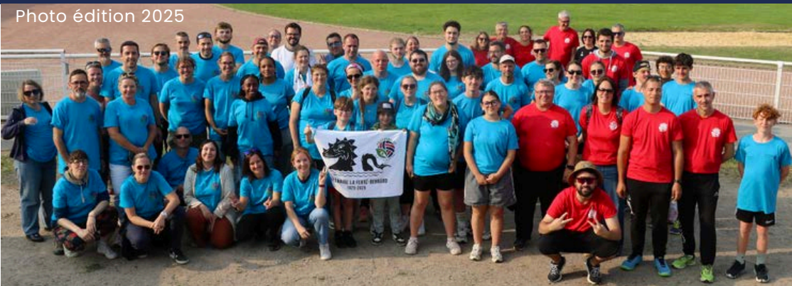
Photo édition 2025