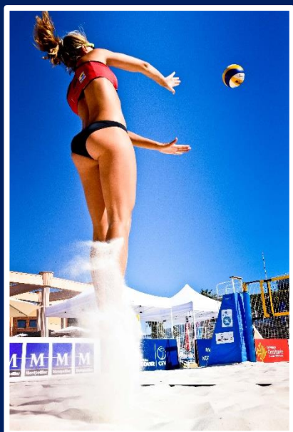
Le Beach Volley

Il n'y a pas de ligne centrale (ne pas gêner le jeu de l'adversaire)