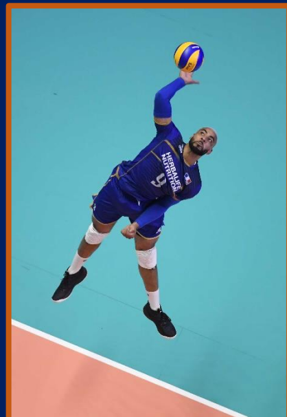
Le Volley « Indoor »

Au Volley-Ball, la ligne d'attaque à 3 m du filet délimitant les zones avant et arrière.