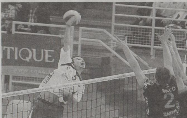
Les partenaires de Moulinier ont su se reprendre en main pour finalement s'imposer.

La seconde manche était la copie conforme de la première : jusqu'à mi-set, les débats étaient équilibrés (17-17), même si les Harnésiens semblaient légèrement dominateurs. Et à nouveau dans le money-time, les portuaires déjouaient et ne pouvaient que constater les dégâts. S'inclinant 20-25 et désormais mené deux sets à rien, les Nazairiens se devaient de réagir sans attendre dans l'optique d'aller chercher des points. Et à nouveau dans la troisième manche, les deux équipes se tenaient en respect (3-3, 10-10). À 13-11, les maritimes réalisaient un mini-break et menaient au score pour la première fois du match.