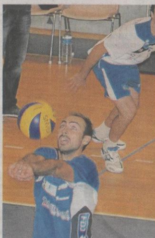
Saint-Nazaire confirme son bon état de forme.

Pas décidés à s'avouer vaincus aussi facilement, les Franciliens sans être