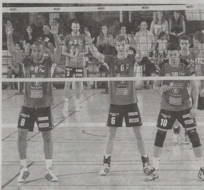
Les Nantais n'ont pas su relever la tête après avoir perdu le 3 e set face aux Lyonnais.

Cela se confirme dans le quatrième set que l'ASUL démarre tambours battants. Plus les points défilent et plus l'écart grandit (jusqu'à +9). La première victoire de la saison est tellement proche que les